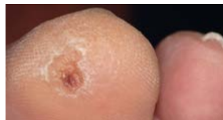
Photo: Fritz Bittig, Podologue et enseignant en Podologie, Auteur de „Bildatlas Podologie“ Foto: Fritz Bittig (podólogo, profesor especializado de podología y autor del libro „Bildatlas Podologie“)